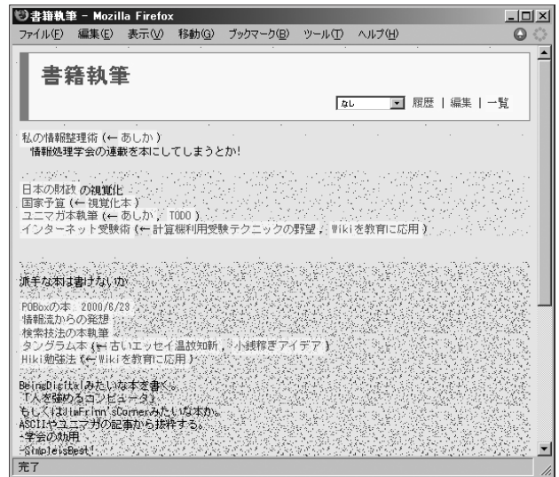
図-4 何度も編集を繰り返しているWikiページ