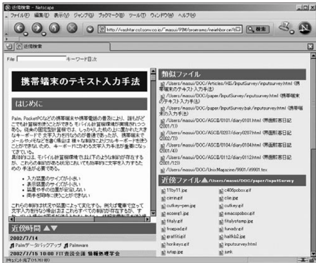
図-3 近傍検索システム