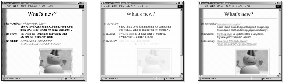
図 4 視覚化効果の適用例—捻れる・色あせる・にじむ Fig. 4 Examples of distortion, fade, and blur effects.

集等の長いリストから新鮮な情報を発見するのに役立つ．実際に，本システムを通して研究室ページのメンバの一覧を見ると，ページを更新している学生と，そうでない学生が一目瞭然であった．