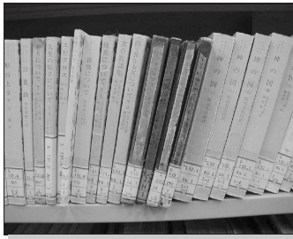
図 1 廃れた書物 Fig. 1 Old books.